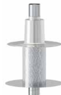
Montiert mit bauseitigem WFR