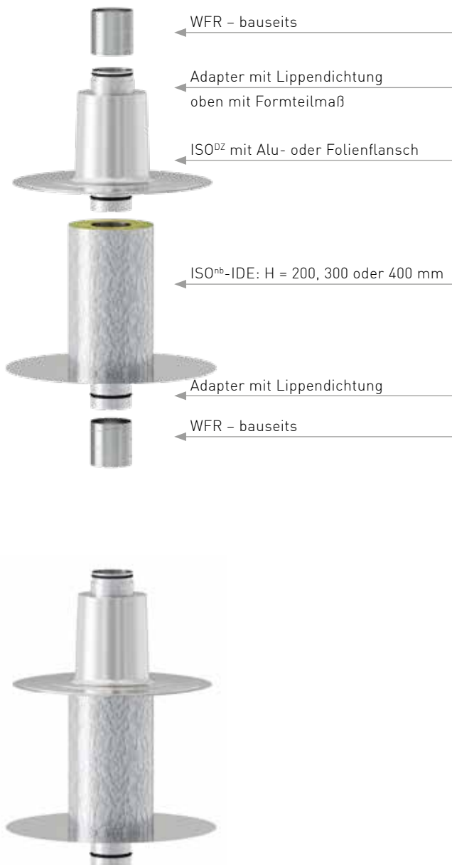
ISO DZ Komplettsystem im montierten Zustand

ISO DZ ist eine Weiterentwicklung des bewährten Komplettsystems ISO nb und wurde speziell als Dachdurchführung für z. B.: Zentrallüftung, KWL-Anlagen o. ä. auf dem Flachdach entwickelt.