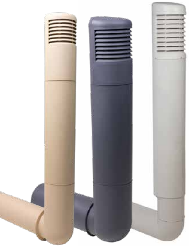
Ross 125/135 Ross 160/170 Ross 200/220