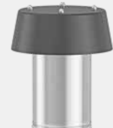
FleSoDur FD Haubenkopf für die sichere Durch- führung von Kabel und Rohre