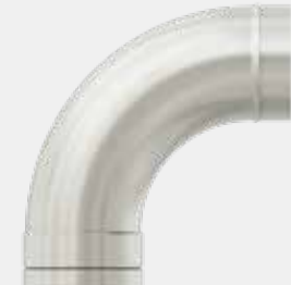
Bogen 90° für Zuluft verzinkt