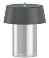
FleSoDur FD Durchführung für Kabel und Rohre