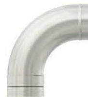
Bogen 90° für Zuluft