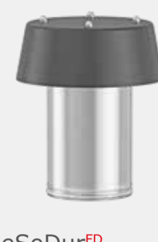
FleSoDur FD Haubenkopf für die sichere Durch- führung von Kabel und Rohre