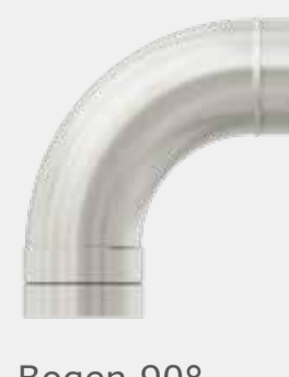
Bogen 90° für Zuluft verzinkt